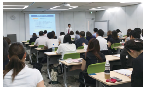
他社の成功事例から、自社の販促ヒントを入手可能。