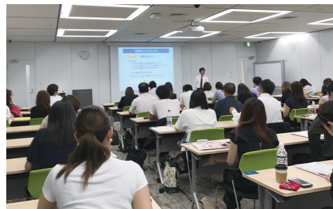
販促やマーケティングのご担当者さまに人気です